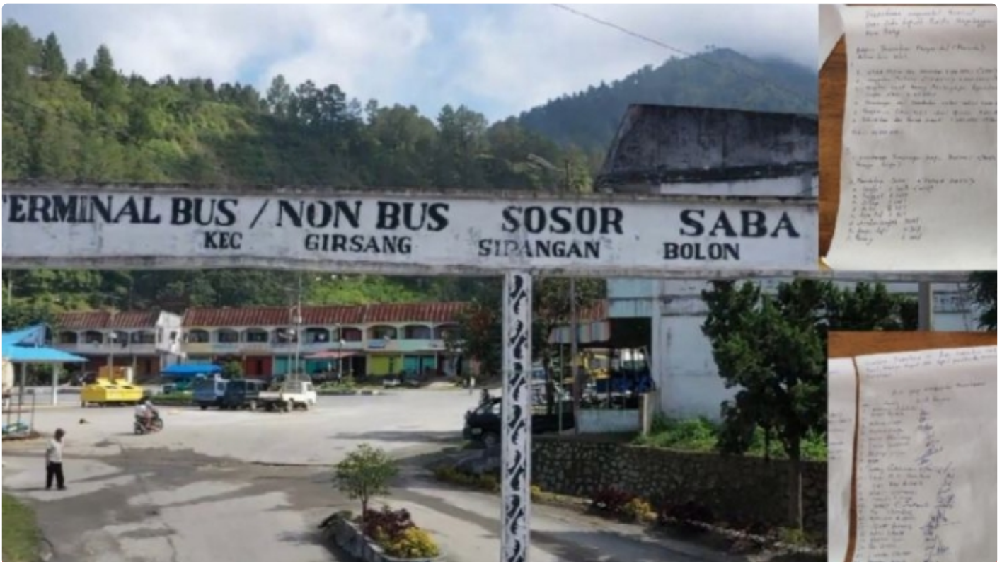
Terminal Sosor Sorba, Parapat, Kecamatan Girsang Sipanganbolon, Kabupaten Simalungun, Provinsi Sumatera Utara

SIMALUNGUN - Jelang pelaksanaan ajang Asia Pacific Rally Championship (APRC), saat ini panitia pelaksanaan datang dengan membawa sejumlah barang yang diperlukan saat berlangsungnya event kejuaraan bergengsi itu.